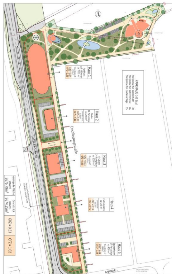
Abbildung 4: Städtebauliches Konzept 2022 (Denda - Architekten)

Direkt an das Parkhaus angrenzend ist die Errichtung einer Gastronomie konkret berücksichtigt und ergänzt die Nahversorgung, auch speziell für die Bewohner des Boardinhouses und auch die Nutzer des teilweise öffentlichen Parkhauses bzw. der geplanten Gewerbebetriebe. Auf den Flächen südlich der Zufahrt von der S4 / Leipziger Straße sind nicht störende Gewerbebetriebe geplant und sollen durch die Lage parallel zur Leipziger Straße diesen Einfahrtsbereich in die Stadt Delitzsch städtebaulich aufwerten und ordnen.