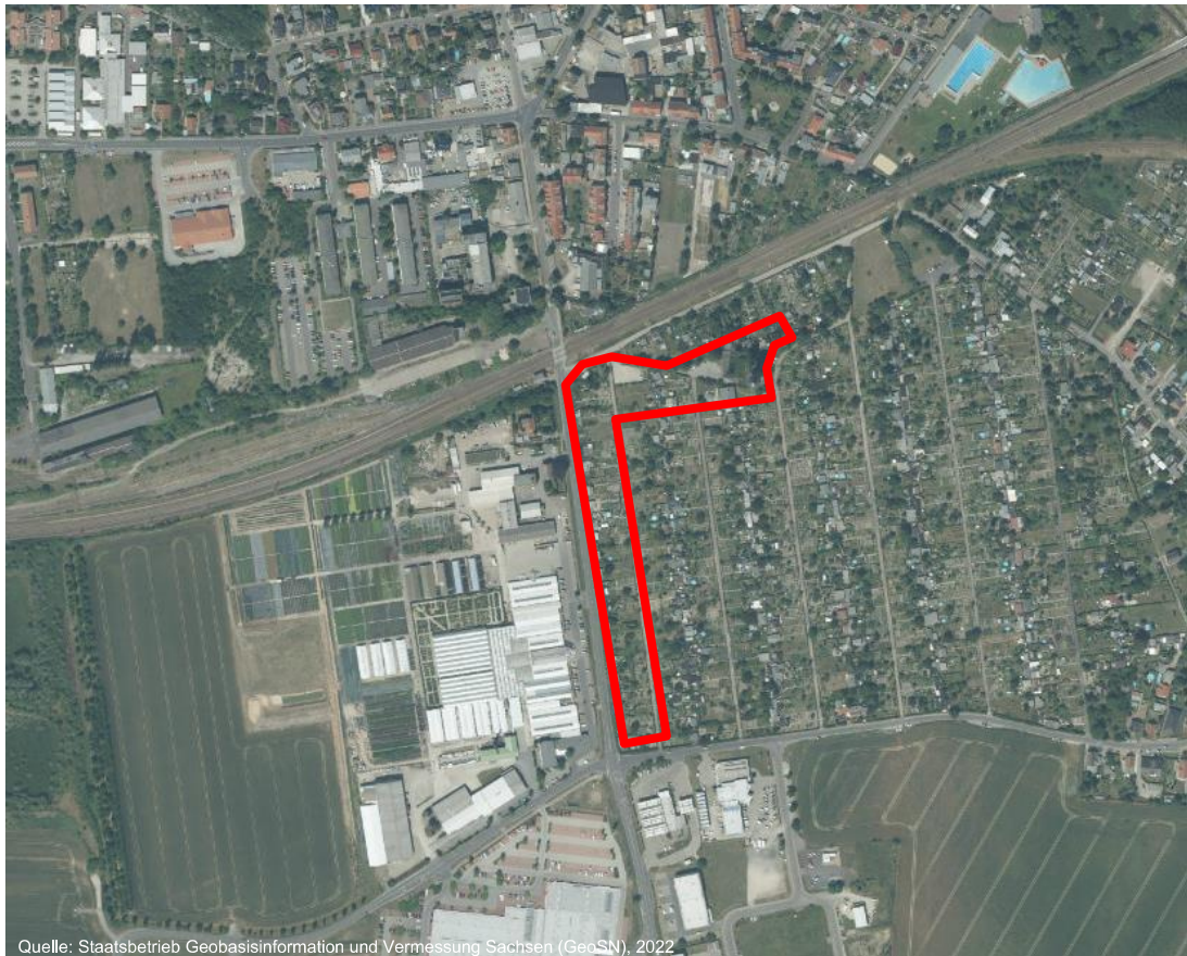
Abbildung 2: Luftbild Vorhabensareal

Der genaue Verlauf der Grenze des räumlichen Geltungsbereiches und die betroffenen Flurstücke bzw. Flurstücksteile können aus der Planzeichnung entnommen werden.